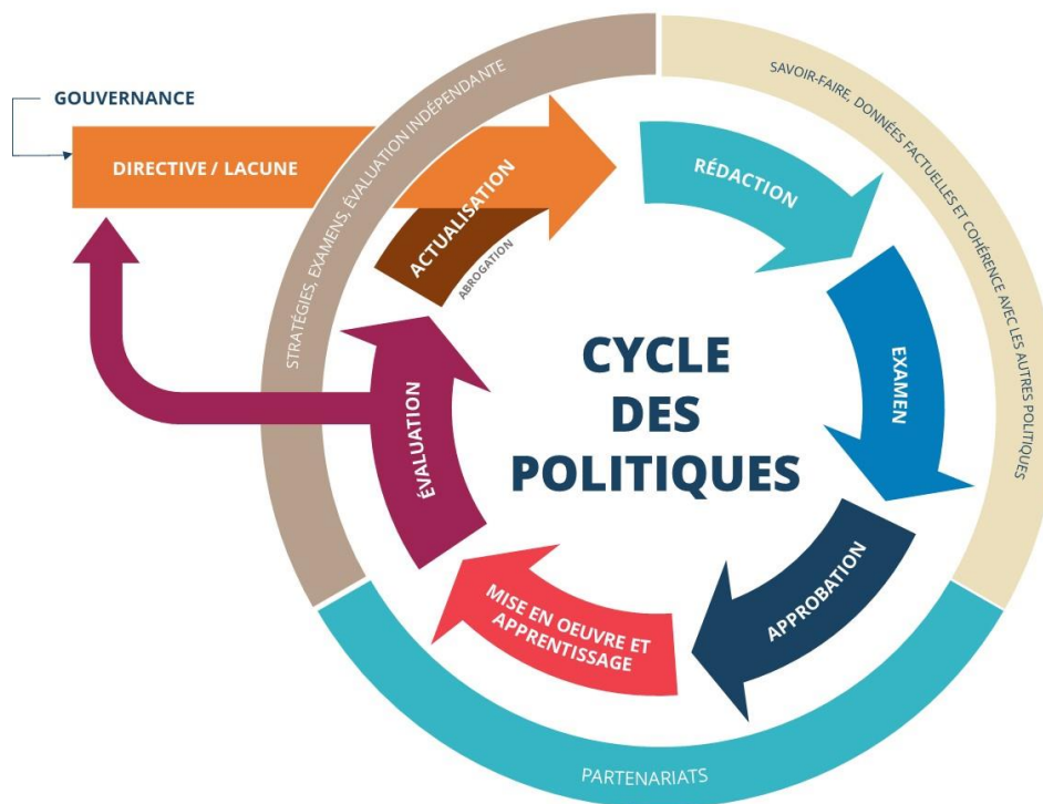
Figure 3: Le cycle des politiques