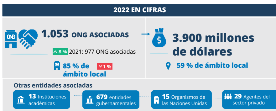
Figura 1: 2022 en cifras

Las ONG 1 , que trabajan con el PMA en la ejecución de actividades diversas relativas a ocho esferas programáticas en 69 países, desempeñaron una función vital ayudando al PMA a prestar asistencia a las personas más vulnerables a la inseguridad alimentaria y la malnutrición. El mayor nivel de actividad de las ONG internacionales y locales se registró en los programas de creación de activos y apoyo a los medios de subsistencia (el 87 % de las ONG asociadas del PMA realizaron actividades al respecto) y en la esfera de las transferencias de recursos no condicionadas (el 79 %), mientras que el menor nivel de actividad correspondió a los programas basados en las escuelas (el 32 %), puesto que los Gobiernos desempeñan una función importante en las actividades de alimentación escolar.