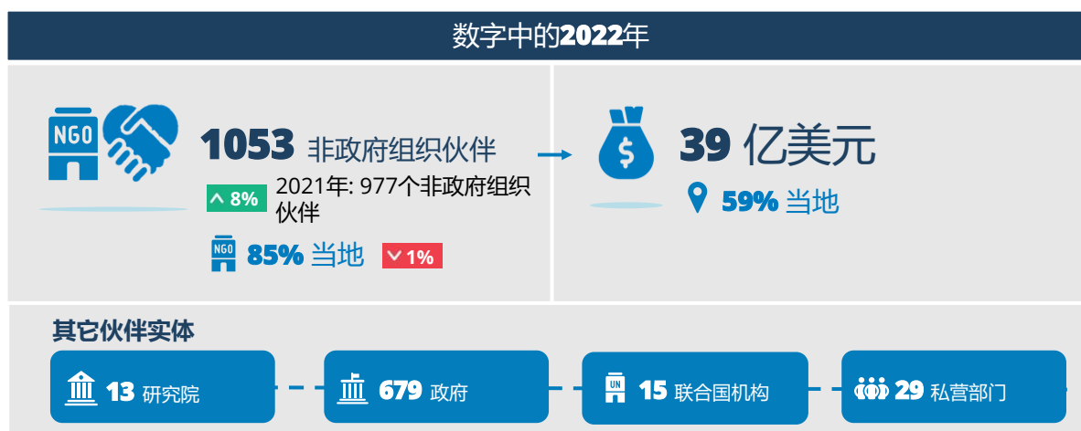
图 1：数字中的 2022 年

非政府组织 1 与世界粮食计划署合作，在 8 个方案领域和 69 个国家开展各种活动，在协助世界粮食计划署帮助最易受粮食不安全和营养不良影响的人口方面发挥了关键性作用。国际和地方非政府组织在世界粮食计划署的资产创建和生计支持方案（占世界粮食计划署非政府组织合作伙伴的 87%）和无条件资源交付（79%）中最为活跃，而在基于学校的方案中最不活跃（32%），因为政府在学校供膳活动中发挥着重要作用。