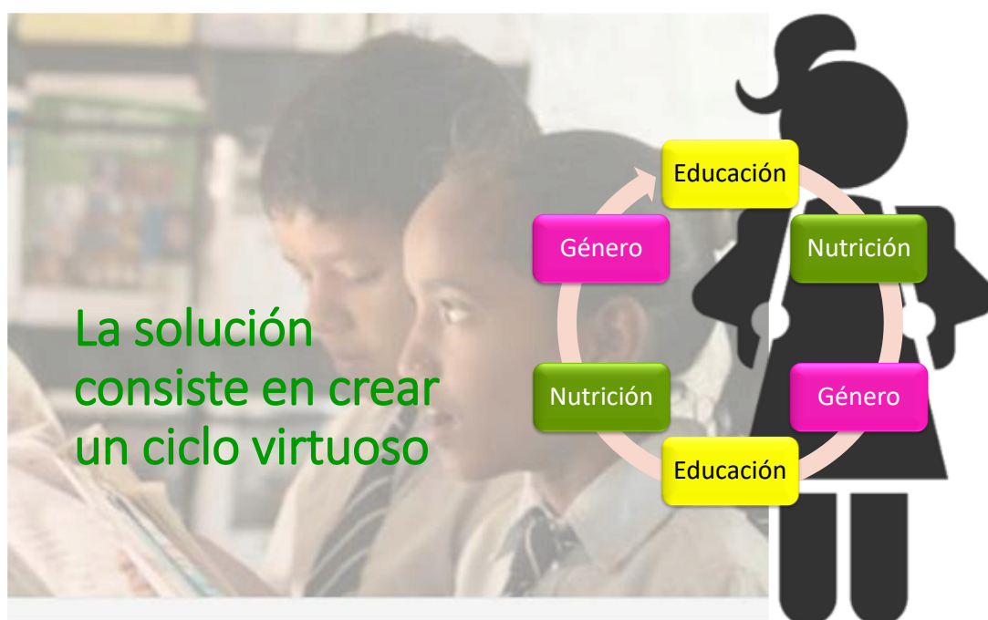
Figura 1: La solución consiste en crear un ciclo virtuoso