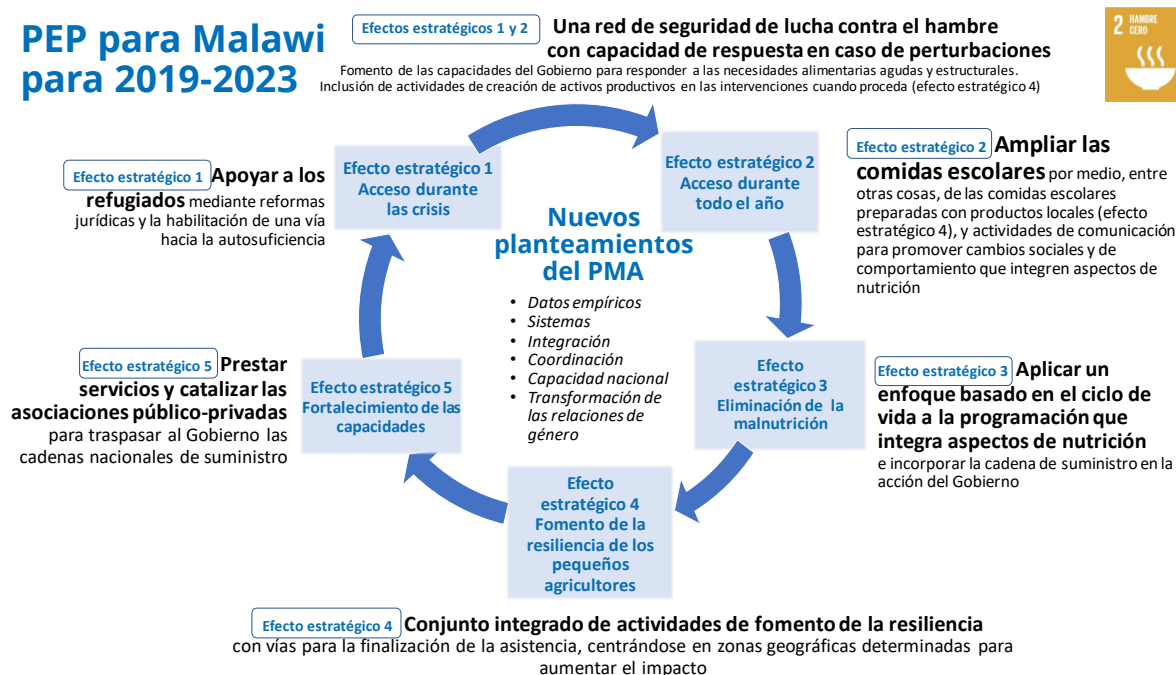
Figura 1: Plan estratégico del PMA para Malawi para 2019-2023: Romper el ciclo del hambre y fomentar la resiliencia