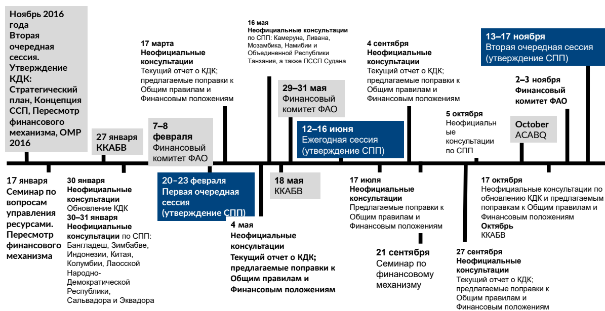
Рисунок 3. Неофициальные консультации 2017 года