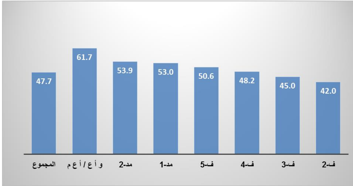
الشكل 4: الموظفون الفنيون الدوليون، حسب متوسط العمر