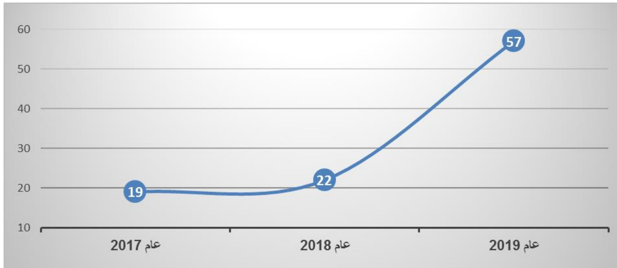
الشكل 3: الموظفون الفنيون الدوليون البالغون سن التقاعد الإلزامية