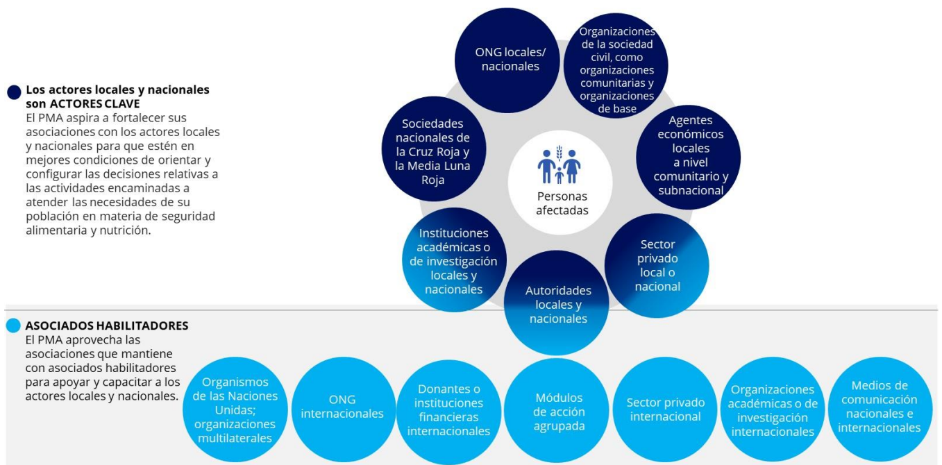
Figura 1: Actores clave locales y nacionales y asociados habilitadores