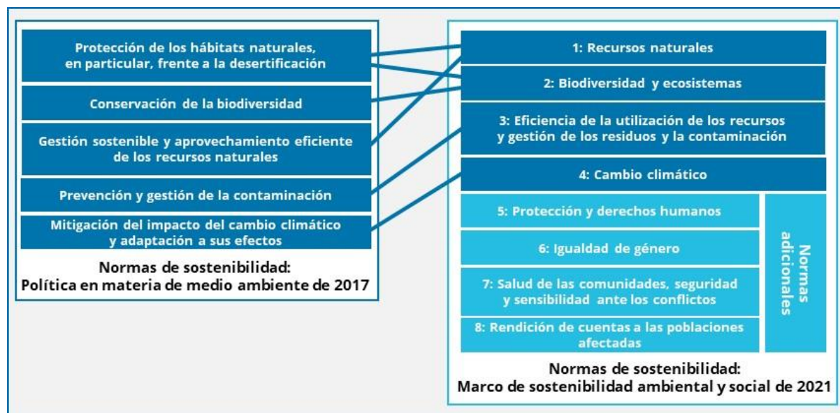
FIGURA 2: COMPARACIÓN DE LAS NORMAS INDICADAS EN LA POLÍTICA EN MATERIA DE MEDIO AMBIENTE DE 2017 CON LAS NORMAS ADOPTADAS EN VIRTUD DEL MARCO DE SOSTENIBILIDAD AMBIENTAL Y SOCIAL DE 2021