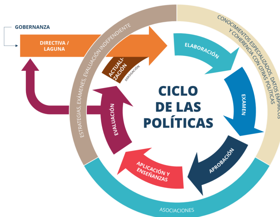
Figura 3: Ciclo de las políticas