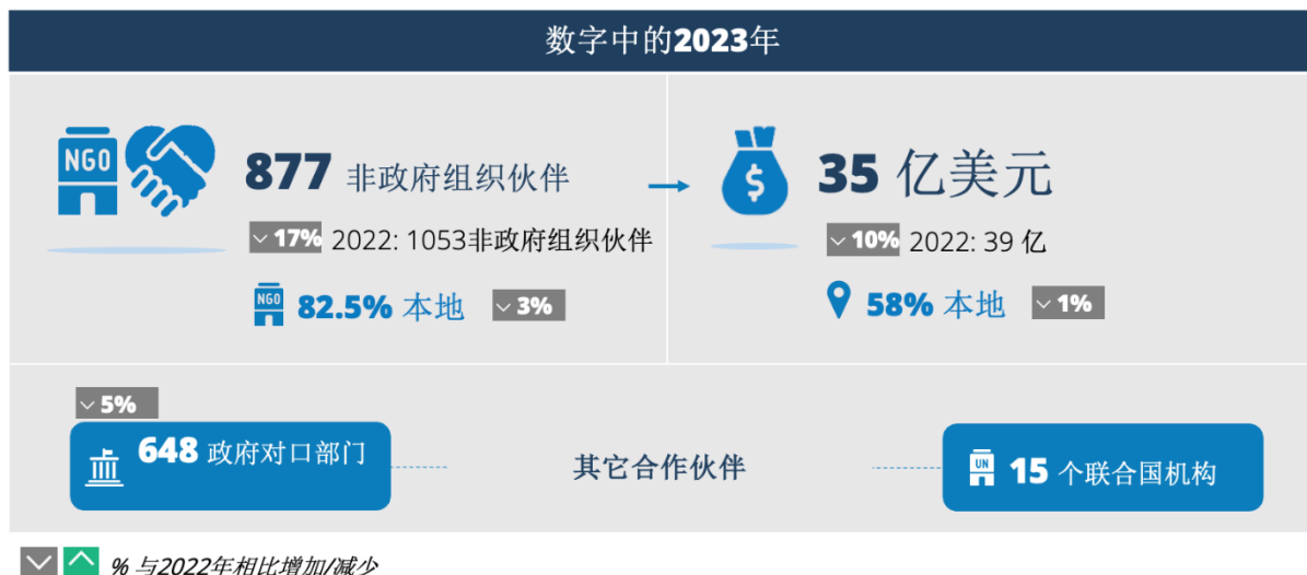
图 1：2023 年合作伙伴数量

注：“政府对口部门”一词是指世界粮食计划署开展业务的国家的各种类型的政府实体，包括经正式授权与世界粮食计划署签订协议的国家、区域、省、区、市或下级的任何实体，包括国家部门或机构。