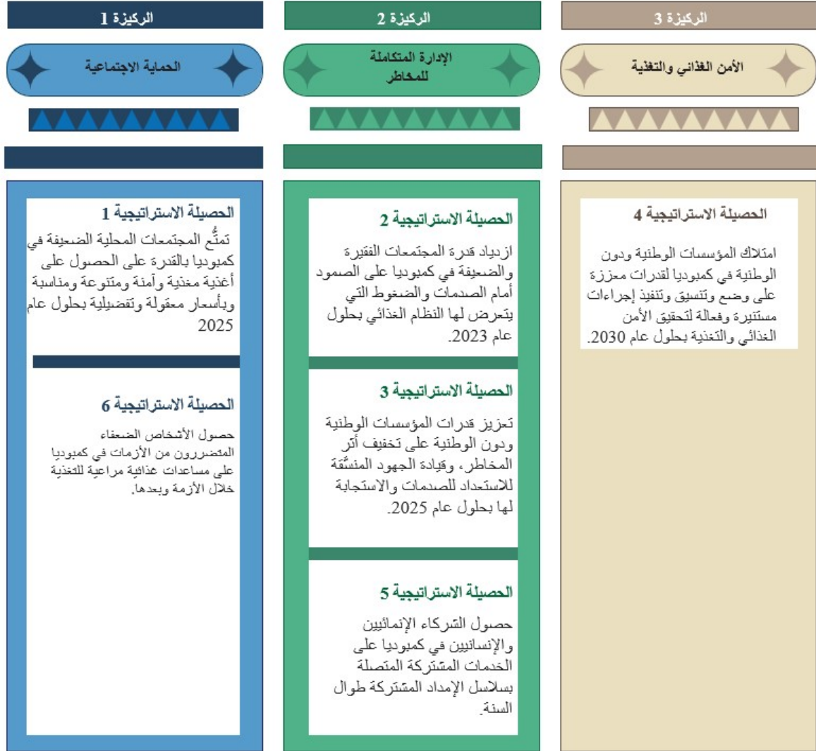
الشكل 2: هيكل الخطة الاستراتيجية القطرية بحسب الركائز

13- لمحة عامة مالية: كما هو مبين في الشكل 3، كانت الميزانية الإجمالية للخطة الاستراتيجية القطرية المؤقتة الانتقالية لعام 2018 قدرها 18 319 500 دولار أمريكي وكان الهدف هو الوصول إلى 544 950 مستفيدا مباشرة بالأغذية والتحويلات القائمة على النقد خلال مدة 12 شهرا. وكانت الميزانية الأصلية للخطة الاستراتيجية القطرية قدرها 50.241 مليون دولار أمريكي على مدى أربع سنوات للوصول إلى 424 640 مستفيدا مباشرة بالأغذية والتحويلات القائمة على النقد؛ وبحلول ديسمبر/كانون الأول 2022، وبعد خمس تنقيحات للخطة الاستراتيجية القطرية، تمت زيادة الميزانية وعدد المستفيدين المباشرين إلى 87 921 370 دولارا أمريكيا و701 930 مستفيدا.