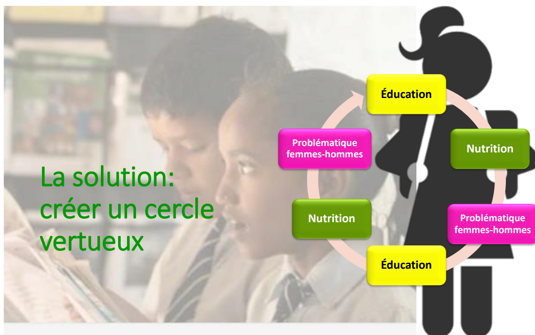
Figure 1: La solution: créer un cercle vertueux