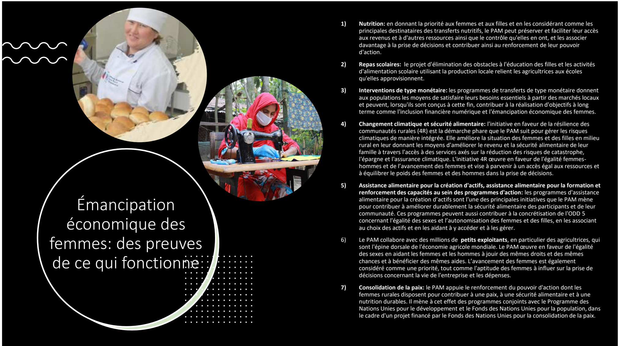
Figure 4: Émancipation économique des femmes: des preuves de ce qui fonctionne