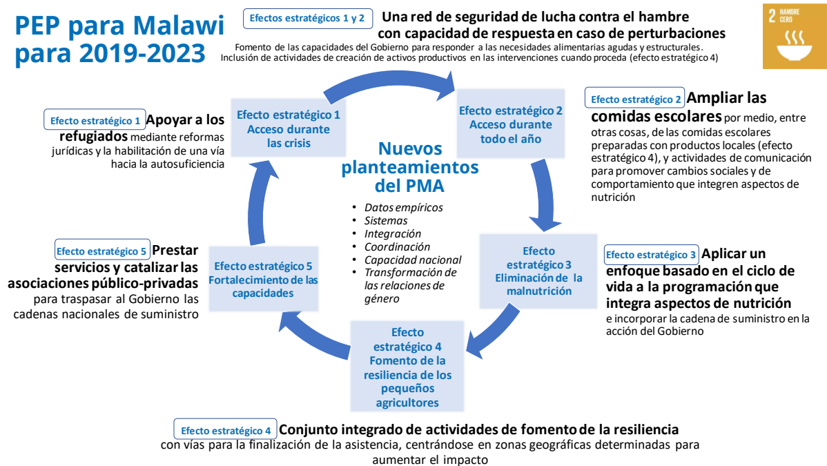
Figura 1: Plan estratégico del PMA para Malawi para 2019-2023: Romper el ciclo del hambre y fomentar la resiliencia