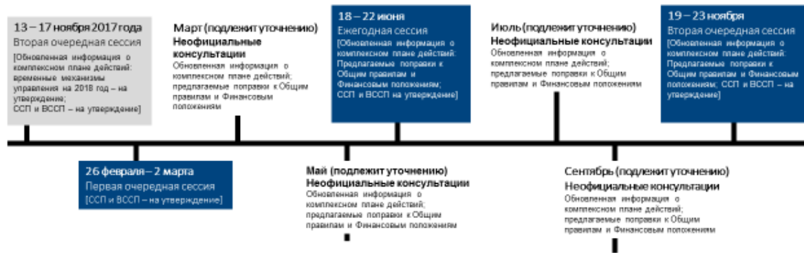
Рисунок 2. Неофициальные консультации в 2018 году