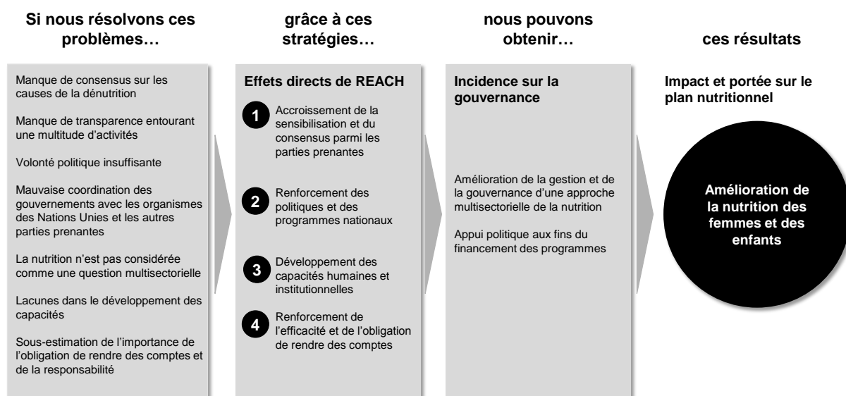
Figure 1: Théorie du changement de REACH