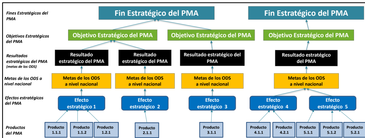
Figura 2 Ejemplo de la cadena de resultados de un plan estratégico para el país del PMA y del plan operacional correspondiente