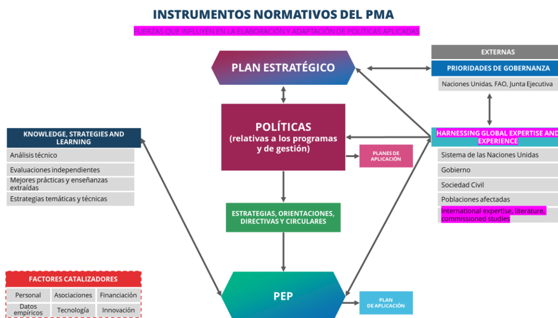
Figura 1: Instrumentos normativos del PMA

Siglas: FAO = Alimentación de las Naciones Unidas para la Alimentación y la Agricultura.