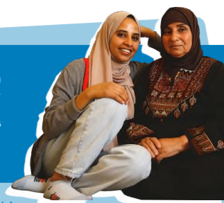
REHAM - EN JORDANIA

“CON UNA BILLETERA ELECTRÓNICA PUEDO COBRAR MI DINERO FÁCILMENTE, AHORRAR, TRANSFERIR A QUIEN QUIERA Y PAGAR CUENTAS.”