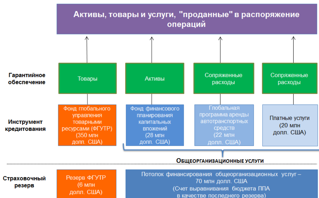
Рисунок 2. Финансирование операций по созданию запасов и общеорганизационные услуги

ограниченных внутренних ресурсов для покрытия финансовых рисков, уделяя особое внимание управлению рисками, связанными с ФГУТР.