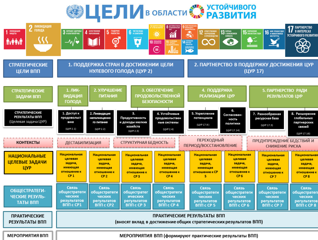
Рисунок 1. Матрица результатов Стратегического плана ВПП на 2017-2021 годы*