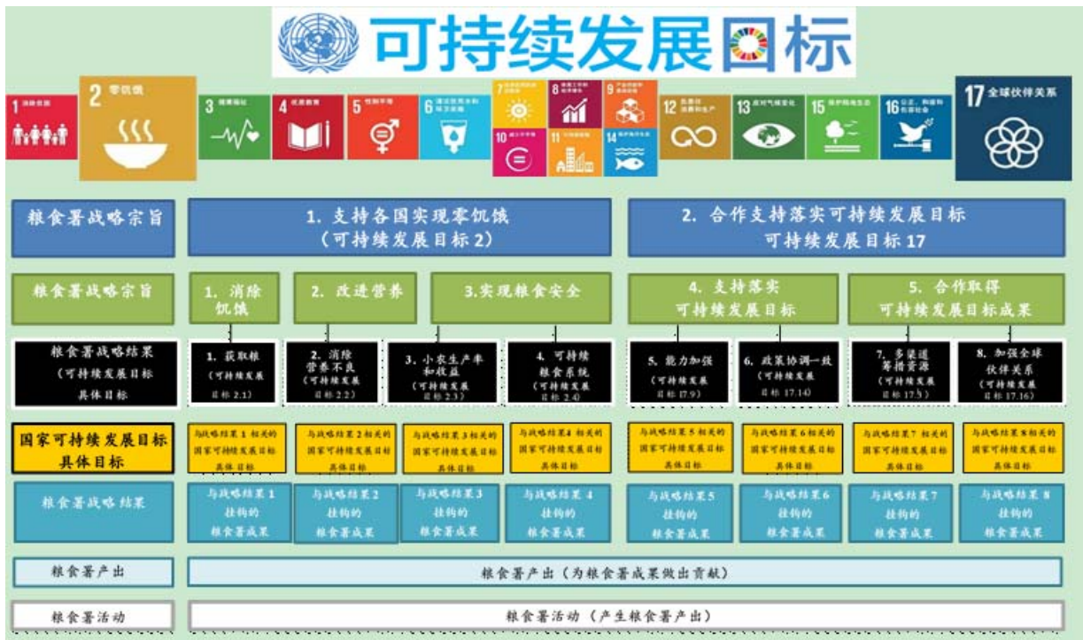
图 1：粮食署战略计划（2017—2021 年）结果框架

绩效管理和预算进程相结合，加强结果管理能力。国别战略计划的设计、规划、实施、绩效管理和报告以结果链为基础；结果链明确了所部署资源与所实现结果之间的关系。如图 1 所示，国别战略计划将粮食署战略计划（2017—2021 年）结果框架转化为国家层面结果链。结果链提供模型，确定实现既定目标的必要步骤，列出如何实现结果的因果关系和基本假设。