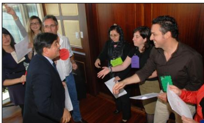
L'une des équipes joue sa saynète.

La sensibilisation des hommes à la question de l'égalité des sexes a été l'un des principaux thèmes de la journée. Les animateurs de l'atelier ont insisté sur le fait que, même si le but premier de bon nombre de programmes intégrant la problématique hommes-femmes était de favoriser l'autonomisation des femmes, il était essentiel de s'attacher le soutien des hommes et de leur donner le même niveau d'information afin de pérenniser les interventions. Pour être efficaces, les programmes et les projets doivent être conçus en prenant en considération les besoins et priorités des deux sexes et en cherchant à apporter les mêmes bénéfices aux hommes et aux femmes. En obtenant l'appui des hommes, on limite également le risque de réaction négative face à l'autonomisation des femmes bénéficiaires. La finalité de la prise en compte de la problématique hommes-femmes dans les activités du PAM n'est pas de modifier l'équilibre des forces mais de parvenir à la sécurité alimentaire.