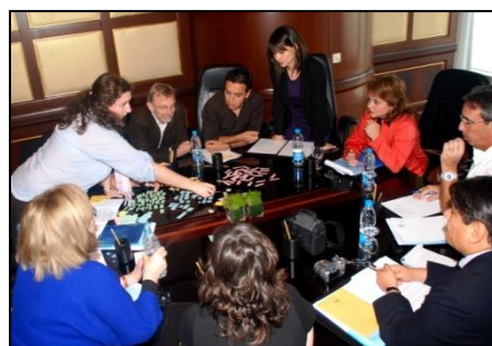
Les participants à l'atelier réalisent un exercice de groupe.

Les participants se sont ensuite livrés à plusieurs exercices pratiques au cours desquels ils devaient représenter les relations hommes-femmes dans leur environnement de travail et analyser des situations d'intervention du PAM en tenant compte des sexospécificités. L'objectif était d'améliorer leurs capacités d'observation, d'analyse et d'innovation à l'aide des méthodes examinées précédemment. Ces exercices leur ont également donné la possibilité de faire part de leurs expériences, de leurs réflexions et de leurs façons de voir respectives.