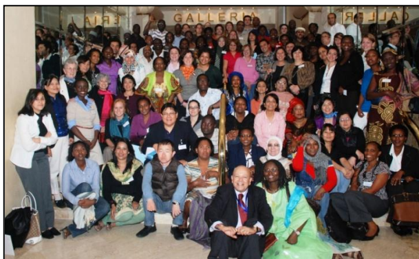
Plus de 80 agents du PAM défenseurs de l'égalité des sexes se sont réunis au Caire pour mettre sur pied le réseau de sensibilisation à la problématique hommes-femmes.

Chacune des trois journées de l'atelier a été consacrée à des débats sur un aspect distinct de la sensibilisation à la problématique hommes-femmes. À la fin de chaque débat, les participants ont été répartis en groupes et ont eu l'occasion de faire part de leurs expériences respectives.