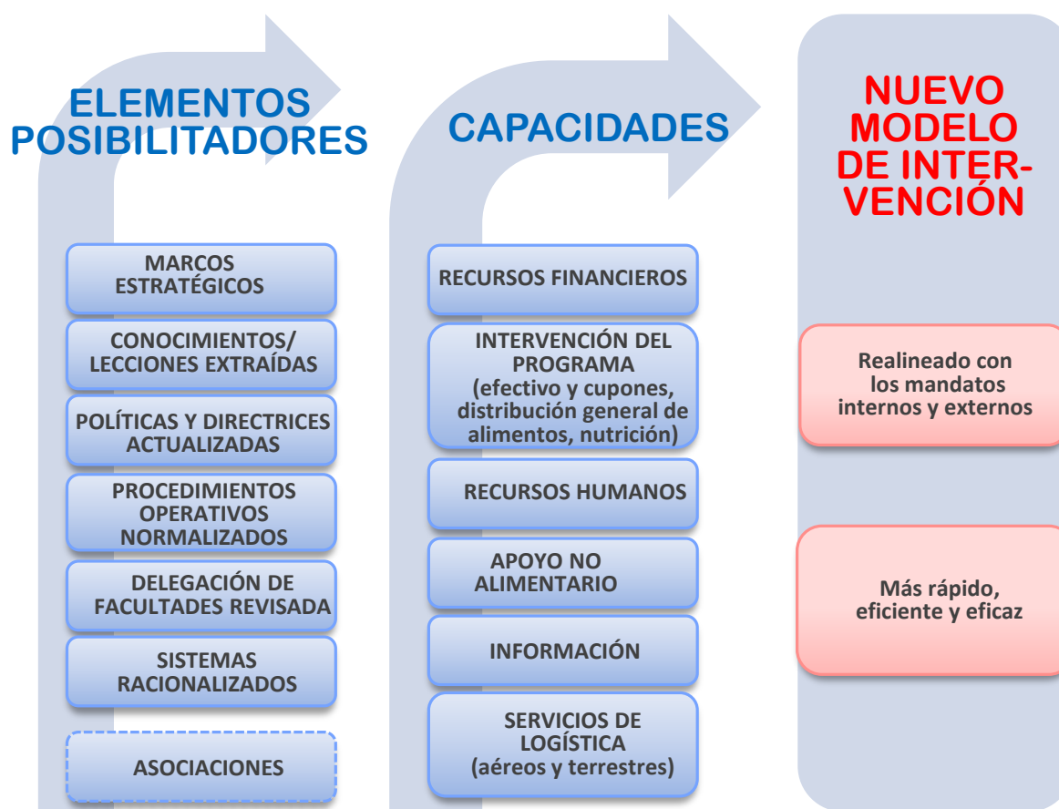
Figura 1: Nuevo modelo de intervención